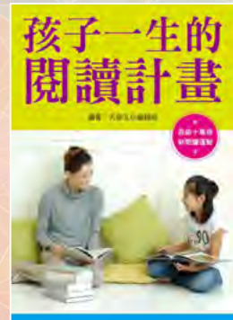
《孩子一生的閱讀計畫》